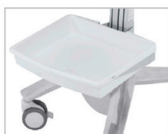
RIPIANO ANTERIORE SV