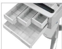
ALTA CONFIGURABILITÀ CASSETTI