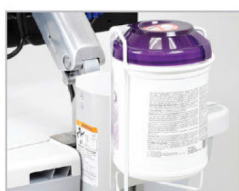
PORTA SALVIETTINE IGIENIZZANTI SV